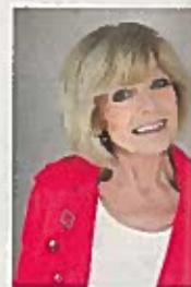
V. KULCSÁR ILDI írása

Finom az ebéd, ragyog a konyha meg a nappali, a gyerek szülői segítséggel megtanulja a másnapra feladott nehéz verset, közben „kivasalódnak” az ingek, pólók, nadrágok, és a mosógép is dolgozik. Csakhogy ezeket a csodákat nem egy tündér viszi véghez, hanem a család valamelyik tagja! Csöndesen, háttérben, láthatatlanul. Fizetség nélkül.